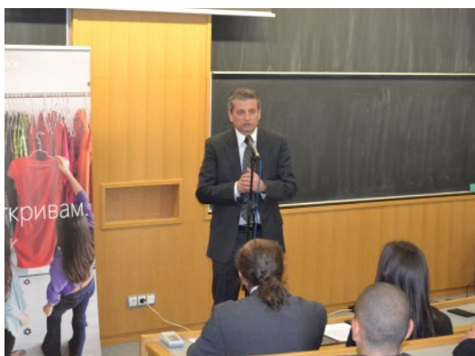
успешна професионална реализация.