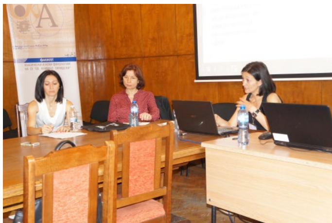
ръководството на БАППА.

Очертаха се следните основни тенденции: големите преводачески агенции, както интернационални, така и национални, се превръщат все повече в доставчици на езикови услуги (language service providers), от които традиционните преводачески услуги са само част; технологиите все повече определят характера както на предоставяните услуги, така и на бизнес организацията на компаниите в сферата на новата езикова индустрия;